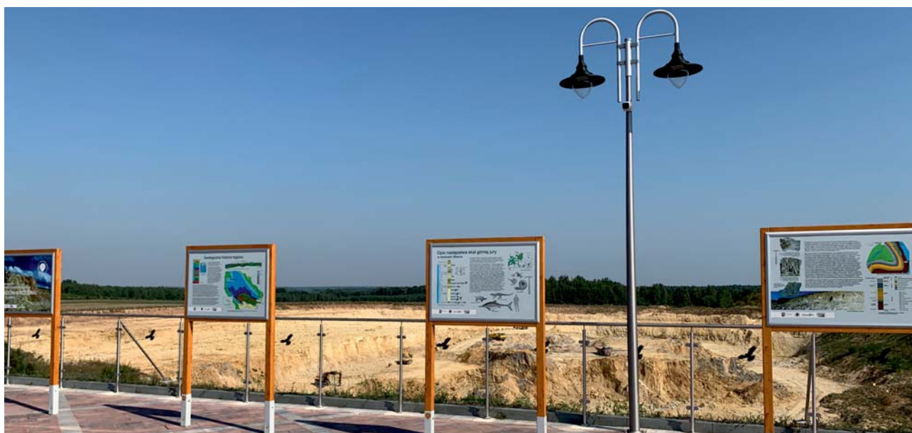
Ryc. 3. Ścieżka geoedukacyjna na tarasie widokowym wzdłuż krawędzi kamieniołomu.

w aktywność społeczności lokalnej i bardzo intensywnej działalności na rzecz geoedukacji.