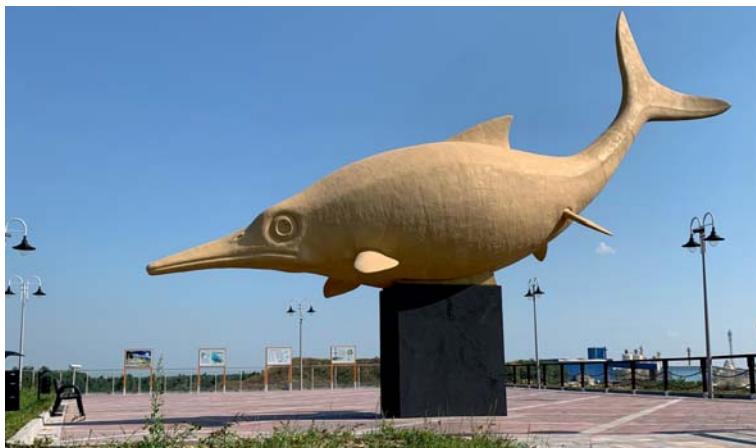
Ryc. 5. W centralnej części tarasu widokowego znajduje się pomnik ichtiozaura, mierzący 12 m długości.

miały miejsce z morskimi obszarami prowincji borealnej (dzisiejsza Arktyka) i prowincji subborealnej – z terenem dzisiejszej Rosji europejskiej (podprowincja rosyjska) oraz Anglii (podprowincja brytyjska), a okresowo także z obszarami południowymi, w tym z obszarem południowych Niemiec oraz, poprzez istniejący pas sztramberskich raf koralowych, z Oceanem Tetydy (Błażejowski i in., 2016; Matyja, Wierzbowski, 2016; Pszczółkowski, 2016; Tyborowski, 2016; Tyborowski i in., 2016).