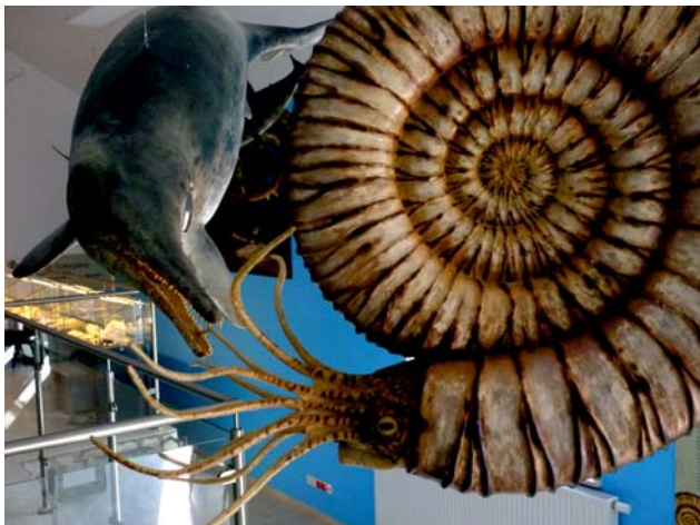
Ryc. 4. W muzeum wyeksponowane są naturalnych rozmiarów rekonstrukcje zwierząt, które zamieszkiwały lokalne morza i wyspy w późnej jurze.

W późnej jurze obszar kontynentu europejskiego pokrywały płytkie morza, w których żyły zróżnicowane organizmy w kilku odrębnych prowincjach i podprowincjach biogeograficznych. Odmienne fauny zamieszkiwały chłodne morza na północy kontynentu, a zupełnie inne żyły w ciepłych morzach na południu. Podobieństwo i powiązania ewolucyjne znalezionych w kamieniołomie Owadów-Brzezinki okazów do organizmów znanych z innych terenów Europy pozwalają stwierdzić, że istniały w przeszłości połączenia morskie umożliwiające swobodne przemieszczanie się tych zwierząt między różnymi obszarami. Fakt ten jest szczególnie istotny w interpretacji paleogeograficznej, bowiem współcześnie osady morskie, wskazujące na dawne morskie połączenia, na ogół się nie zachowały, gdyż zostały usunięte przez późniejszą erozję. Połączenia takie